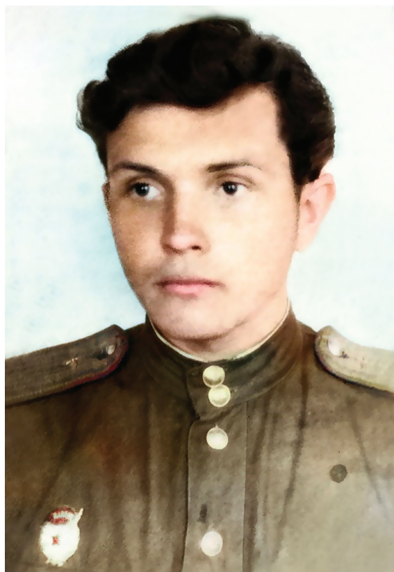
Александр Зиновьев в годы Великой Отечественной войны

1946—1954: Московский университет. Это были годы студенчества и аспирантуры на философ-