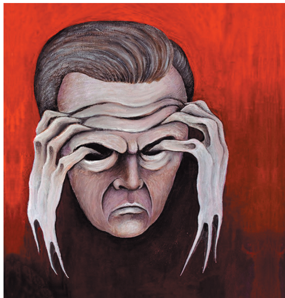
А.А. Зиновьев. Автопортрет

Зиновьев сразу по приезде обозначил свою позицию по этому поводу. На вопросы журналистов и собеседников, называвших его жертвой режима и интересовавшихся тем, как он ощущает себя в свободном мире, он отвечал, что не считает себя жертвой (его часто повторяемая формула: “режиму досталось от меня больше, чем мне от режима”) и что он всегда оставался свободным человеком. Он, блестящий знаток многозначной логики, не давал загнать себя в формальную ловушку идеологии холодной войны. Он не считал себя