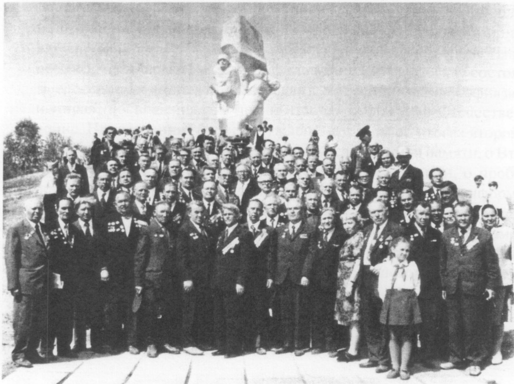
Выжившие курсанты Подольского военного училища в день открытия памятника на Ильинском рубеже