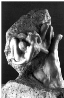
Рис. 1. Огюст Роден. Рука Господа. Ок. 1898. Мрамор. Высота 92,9 см. Музей Родена. Париж.

денции неразрывно связаны, поэтому постановка в моей статье в центр внимания лишь второй тенденции отвечает не сути дела, а сопутствующим ее написанию обстоятельствам.