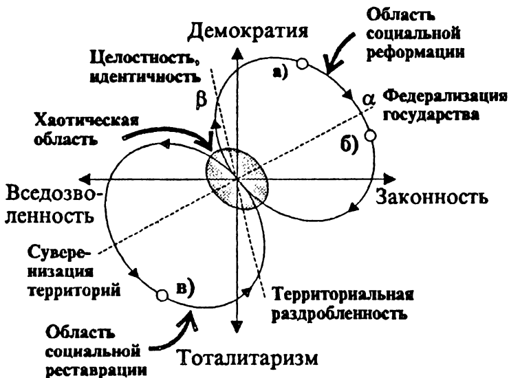
Рис. 2. Сопряженные циклы эволюции, или "восьмерка блужданий" постсоюзной России.

здесь российское кризисно-реформируемое общество, можно представить, как и союзный кризис, в виде перекрестка постсоюзных дорог. На российской почве он превращается в социальную перепутаницу, где разные пути-дороги спутываются, превращаются в сопряженные круги блужданий постсоюзной России по полю возможных путей своего изменения. Их сопряжение образует хаотическую область, правый верхний круг - область социальной реформации, а левый нижний круг - область социальной реставрации или деградации (см. рис. 2).