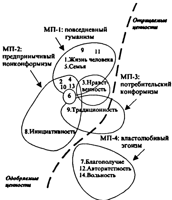
Рис. 3. Ценностные макропозиции (МП): основной массив респондентов.