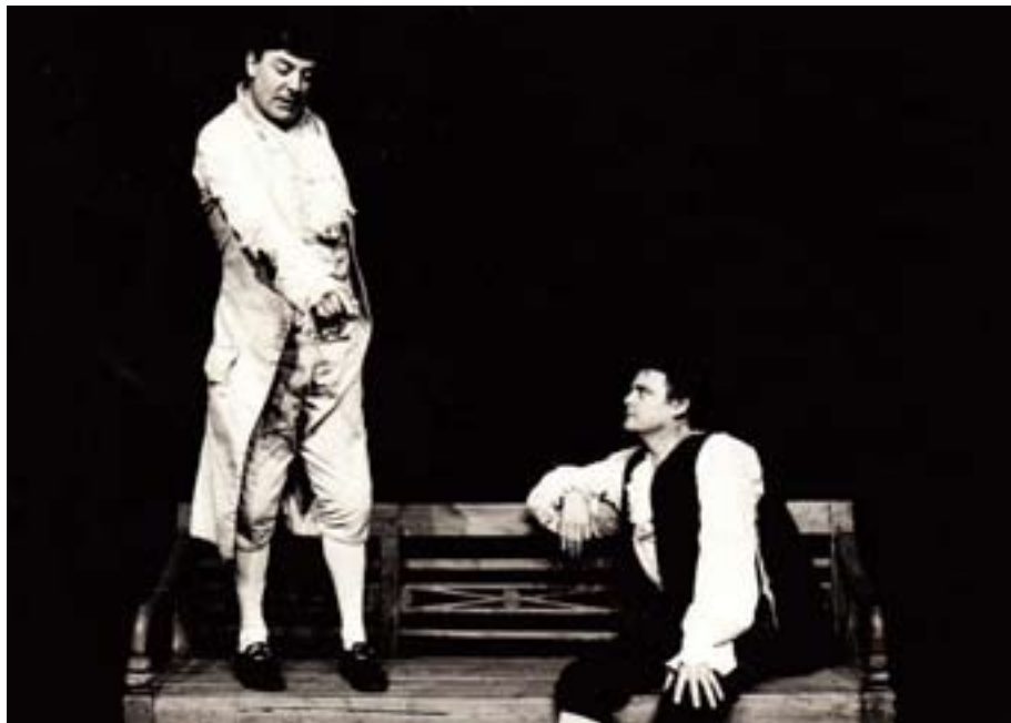
Племянник Рамо. Постановка Даниэля Бесса. Театр 7, Франция

Ведь если признать, скажем, что природа включает в себя пороки, то неизбежно придем к признанию необходимости воспитания, а, задавшись вопросом, на что должно ориентироваться воспитание, вынуждены будем возвратиться к природе (больше не к чему), так что ход мысли следует обозначить как некую «винтовую лестницу», т. е. непрерывное движение от тезиса к антитезису и обратно, и т. д. Здесь нет