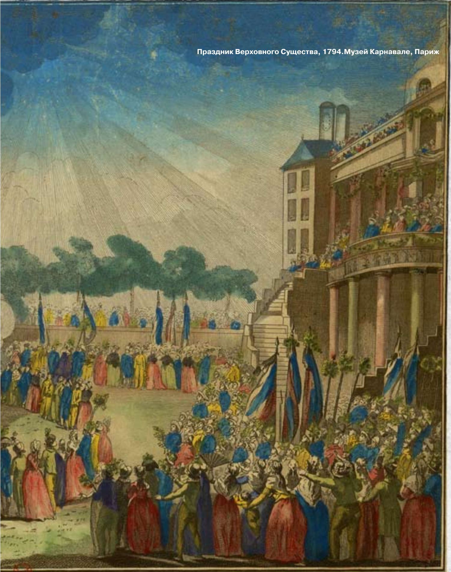
Праздник Верховного Существа, 1794. Музей Карнавале, Париж

AL ET DES DÉCORATIONS, ème le Decadi 20 Prairial l'an 2. de la Republique Francaise.